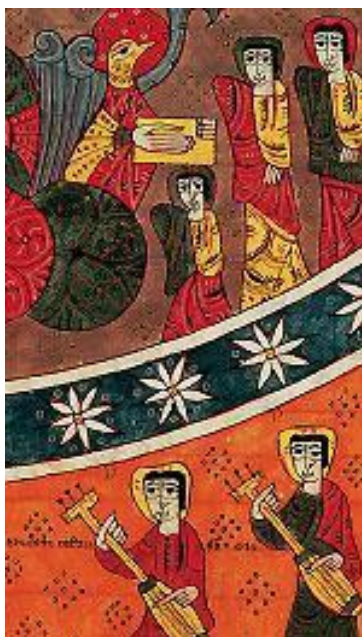
Zbožnost sv. Petra z Cardena, XII. stol.