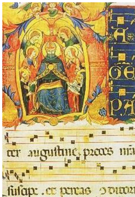
Knihy hodin. Renato d'Anjou.anon. XV. stol.