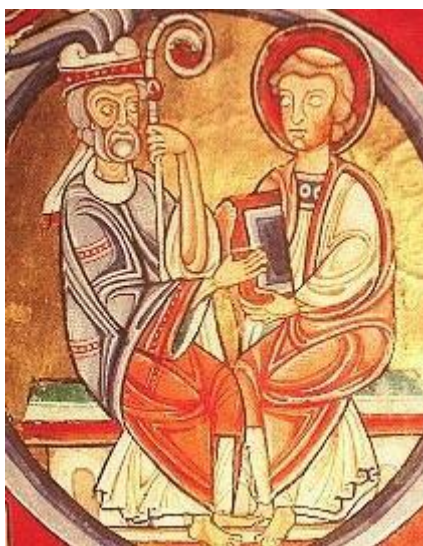
miniatura, XII. stol.