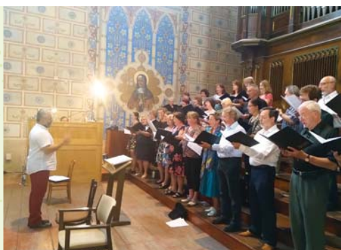
Duchovní koncert v bazilice Nanebevzetí Panny Marie (21. 7. 2019)