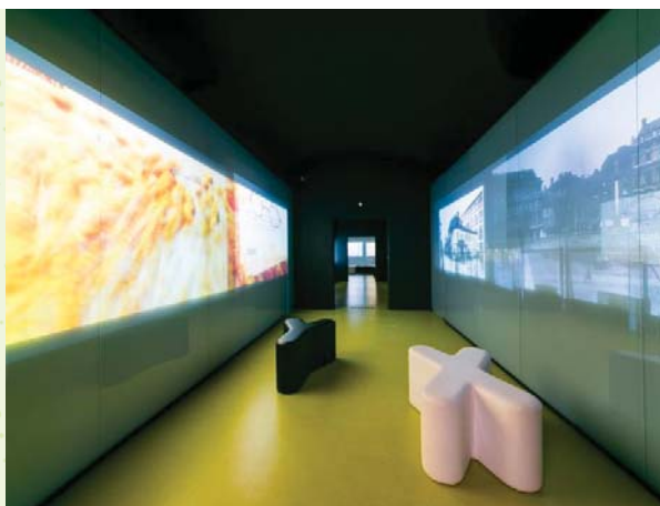
Expozice Mendelova muzea Masarykovy univerzity