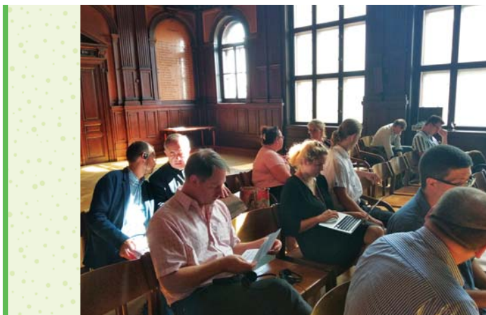
Účastníci na workshopu ve Vídni

Cílovými skupinami projektu byly především rodiny s dětmi, žáci, studenti, ale i odborná veřejnost.