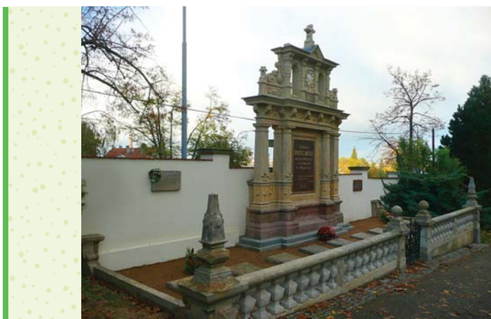
Hrobka augustiniánů na Ústředním hřbitově v Brně

Mendelovo poznání a představení tajů genetiky však nebylo jeho současníky pochopeno. Své slávy dosáhl až posmrtně. V klášteře Mendel působil do konce svého života, po mnoho let také zastával funkci opata. Dne 6. ledna 1884 Mendel umírá na infekci ledvin ve věku nedožitých 62 let, pochován byl o tři dny později v augustiniánské hrobce na brněnském Ústředním hřbitově.