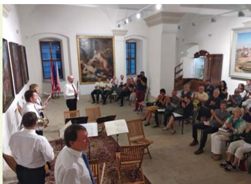
Vystoupení Janáček Ensemble, Sál Augustiniánského opatství (19. 7. 2019)

Hlavní cílovou skupinou festivalu jsou rodiny s dětmi, čemuž je uzpůsoben i program akce: workshopy, open air pokusy, zábavné laboratoře, soutěže pro děti, komentované prohlídky, koncerty, apod. Sobotní večer byl zakončen světelnou show s videomappingem vztahujícím se k životnímu dílu a odkazu Mendela.