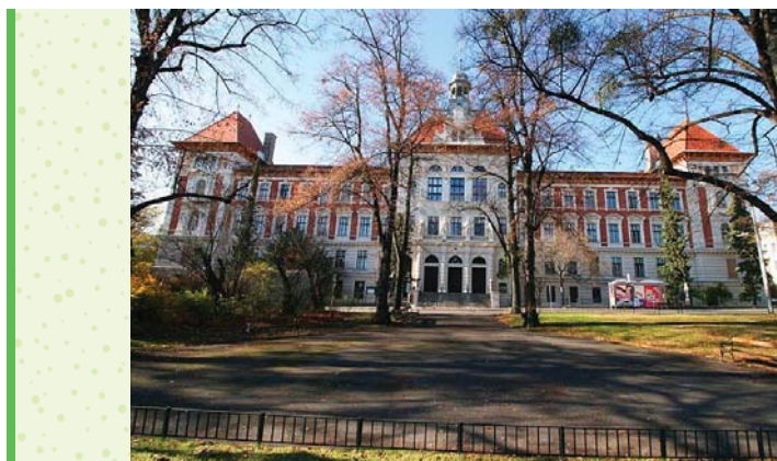
Gregor Mendel Haus ve Vídni