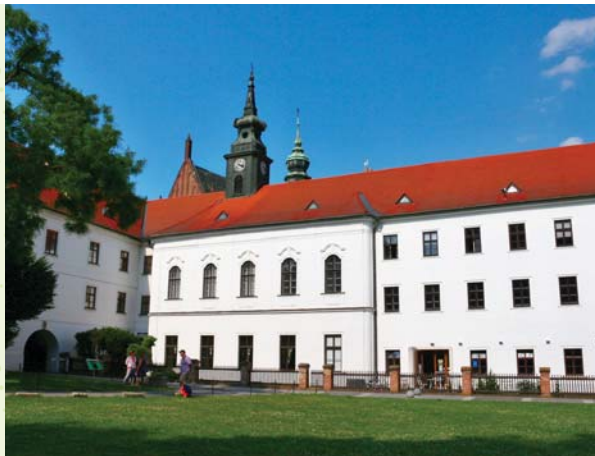
Augustiniánský klášter na Starém Brně