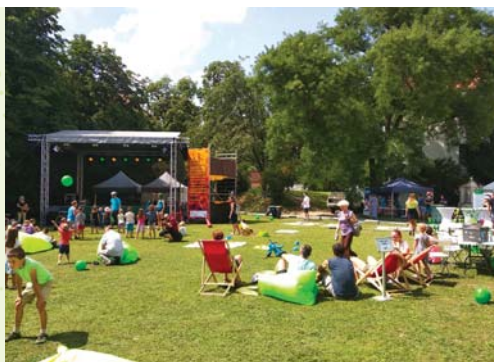
Zábavný dětský program na festivalu „Mendel je...“ (20. 7. 2019)